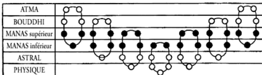
LES SEPT CHÂÎNES DU SYSTÈME DONT FAIT PARTIE LA TERRE

Cependant, la maîtrise sur le monde mental inférieur, sur la totalité des pensées concrètes ne nous donne pas pleine satisfaction, car à travers ce monde et au-delà, nous sentons parfaitement qu'il y a d'autres mondes à conquérir.